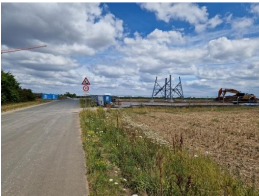
Abbildung 6: Errichtung Mast.