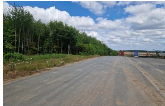
Abbildung 5: Waldparzelle.