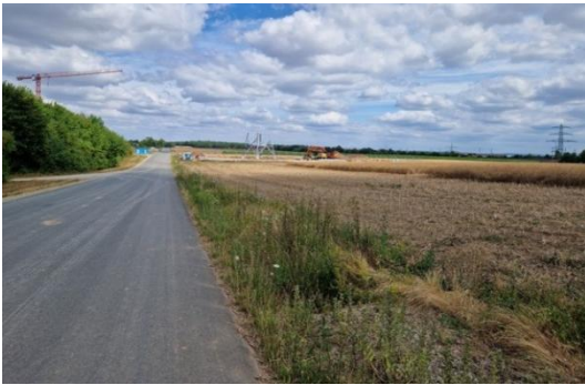
Abbildung 4: Blick entlang der Zufahrtsstraße nach Norden mit Ackernutzung, Waldparzelle und Baugeschehen, Masten und Konverterstation.

Waldparzelle begrenzt. Nördlich davon schließen ein Schotterweg (V32) sowie die Konverterstation (O7/X3) an, die sich derzeit im Bau befindet. Zwischen Konverterstation und Umspannwerk wurden zum Zeitpunkt der Begehung Masten errichtet. Die Bauflächen (O7) werden nach Abschluss der Maßnahme zurückgebaut und die Ackerflächen (A11) wiederhergestellt. Es verbleiben die Masten (P5) als versiegelte Fläche.