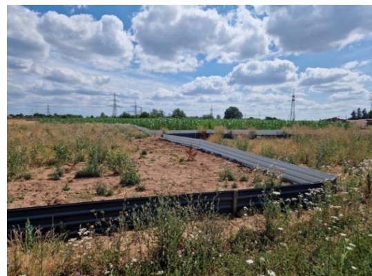
Abbildung 9: Artenschutzrechtliche Maßnahmen im Rahmen des Bauvorhabens Mast.