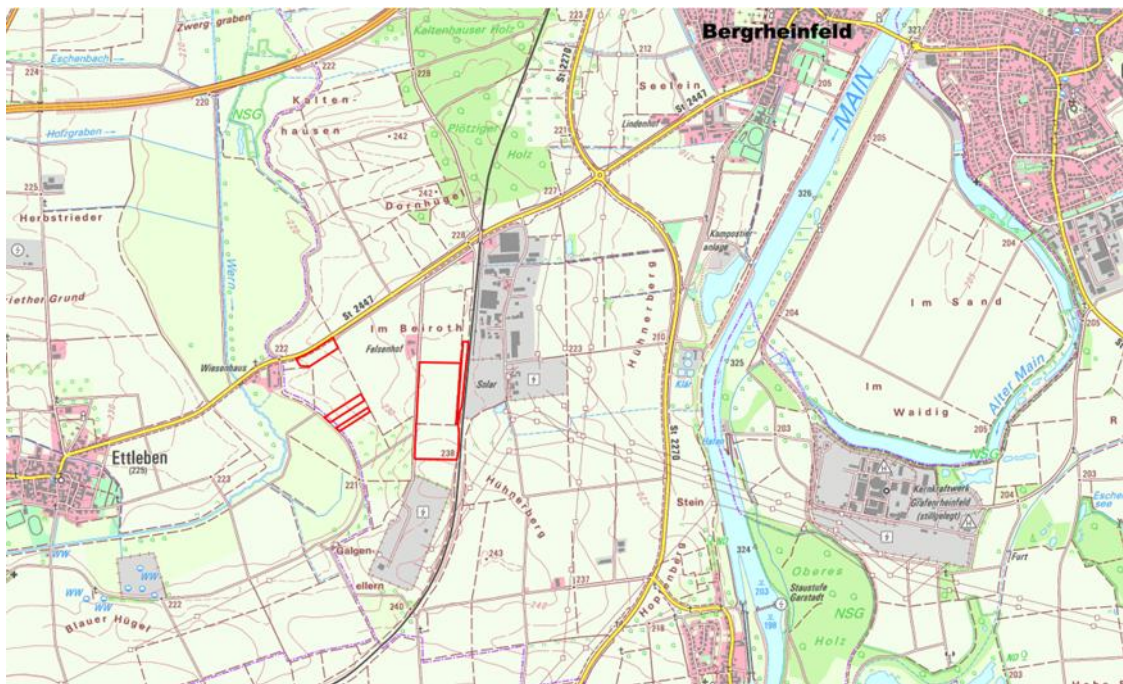
Abbildung 1: Lage der Änderungsbereiche nördlich des bestehenden Umspannwerks Bergheimfeld-West, Plangebiet rot (Kartengrundlage: Bayerische Vermessungsverwaltung, EuroGeographics).

Das Plangebiet sowie die externen Ausgleichsflächen befinden sich auf einer bisher landwirtschaftlich genutzten Fläche und sind unbebaut. Im Umfeld des Geltungsbereiches bestehen unterschiedliche Flächennutzungen, die Restriktionen für den Geltungsbereich nach sich ziehen. Auf Kap. 1.2 in der Begründung zur Änderung des Flächennutzungsplanes wird verwiesen.