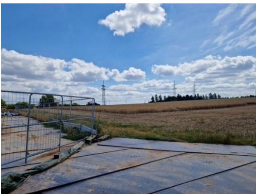
Abbildung 8: Zentraler Grünweg; Inanspruchnahme durch Bauvorhaben Mast.