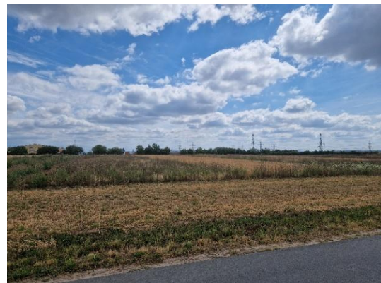
Abbildung 7: 3-Streifen-Bewirtschaftung für den Feldhamster nördlich des Geltungsbereiches.