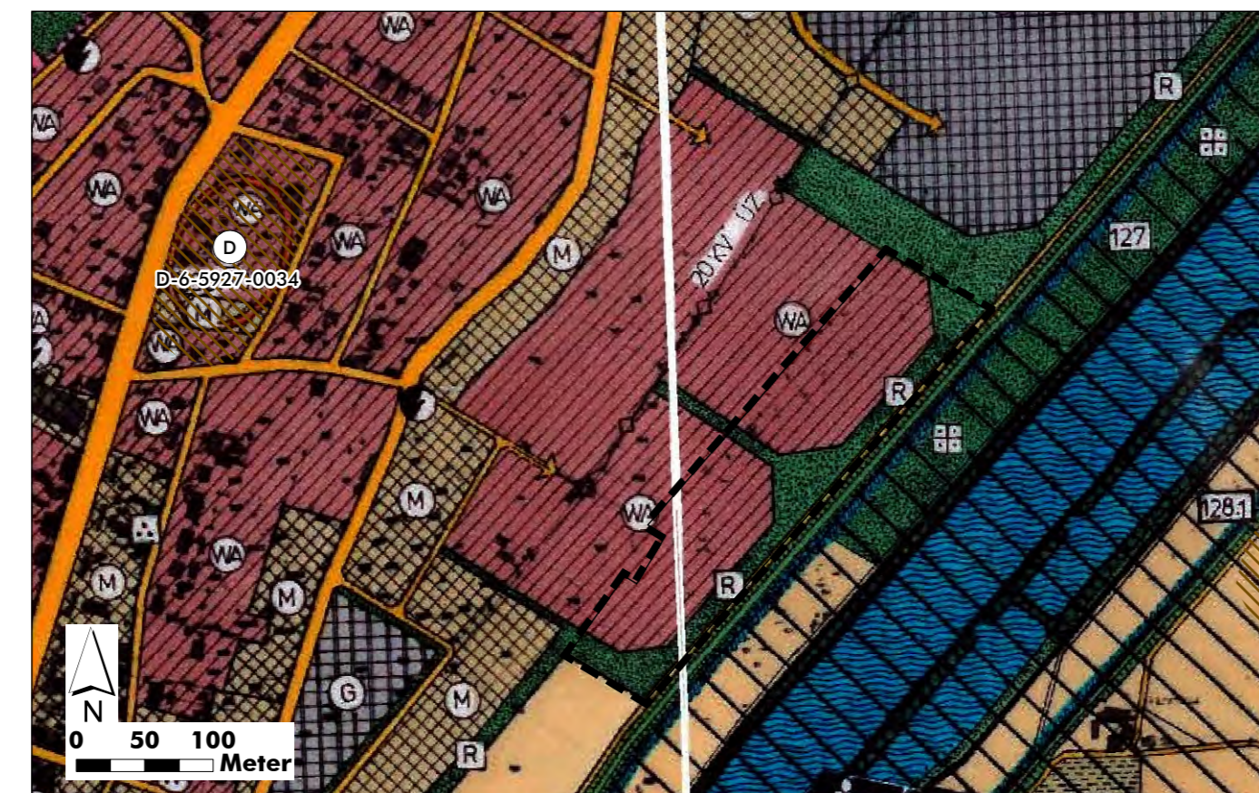
Rechtskräftiger Flächennutzungsplan mit integriertem Landschaftsplan in der Fassung der 3. Änderung vom 13.09.2002 bzw. der 4. Änderung vom 18.10.2004