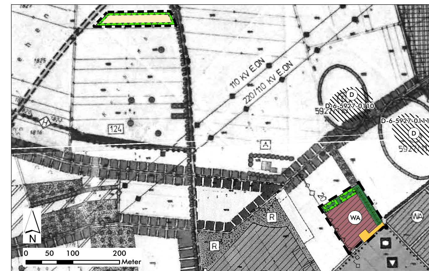
7. Änderung des Flächennutzungsplans im Bereich des Bebauungsplans "Holderhecke Nord"