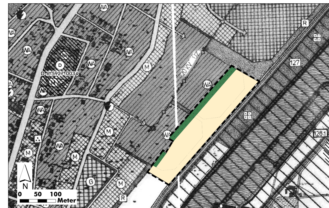
7. Änderung des Flächennutzungsplans im Bereich der Wohnbauflächen "Wad 3"