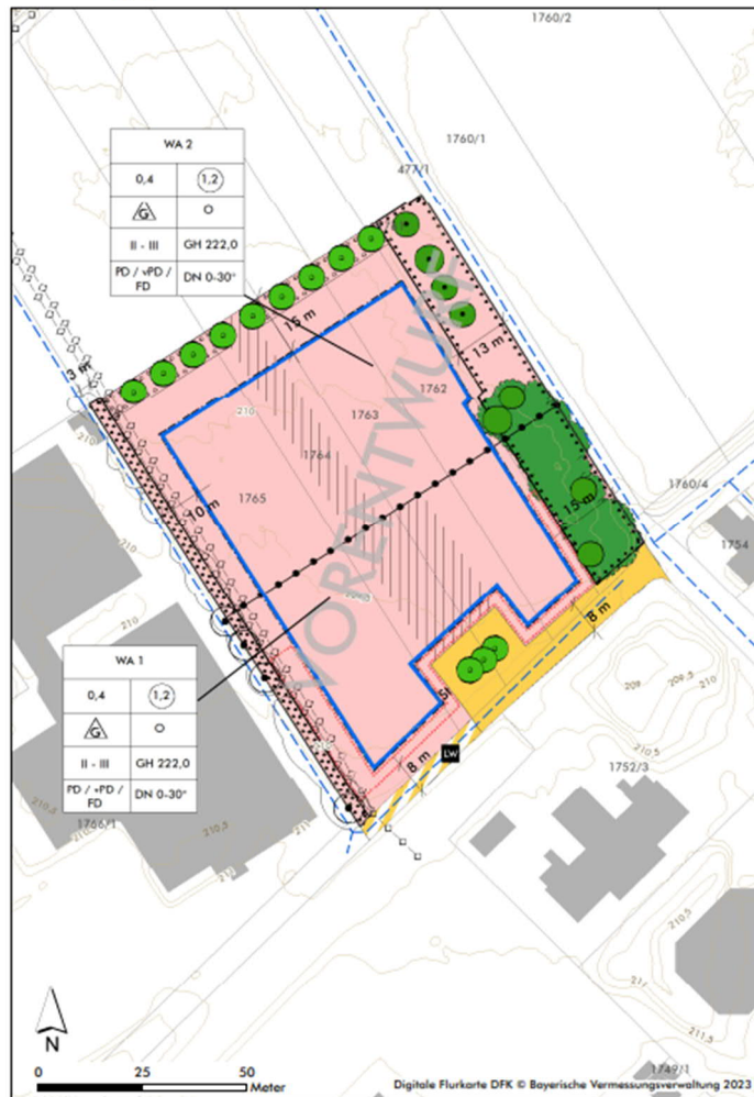
Abbildung 1: Ausschnitt B-Plan-Vorentwurf /2.2/

Bezogen auf den B-Plan-Vorentwurf und dem dazu beigefügten o. g. IBAS-Schallgutachten sind in einer ersten Runde der Beteiligung von Trägern öffentlicher Belange Stellungnahmen, u. a. zu möglichen bislang nicht bewerteten Geräuschbeiträgen aus der weiteren Umgebung, eingegangen /2.2/.